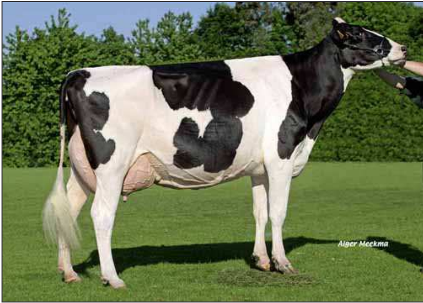
Coum Vélia (grand-mère de Botvilla Finia).