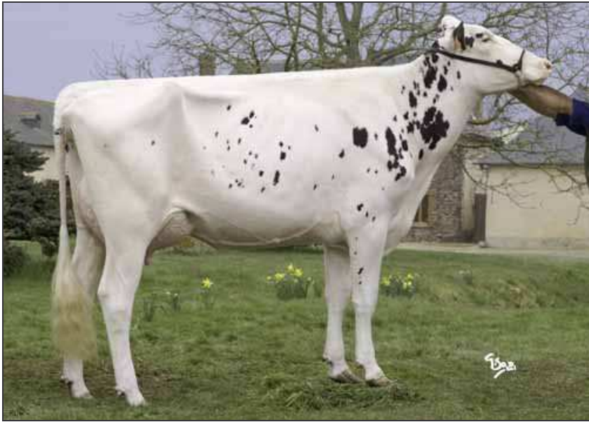
Aline (mère de Excellente).