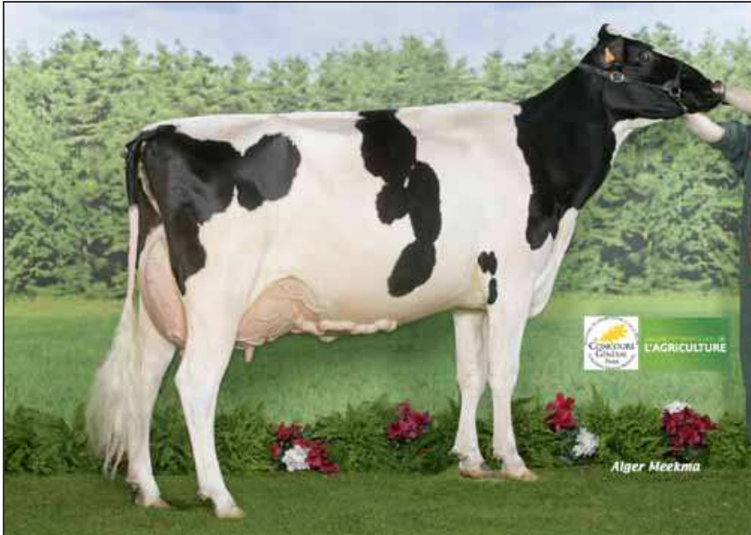
Pébi Venel en 3 e lactation (mère de Mel'Estelle).