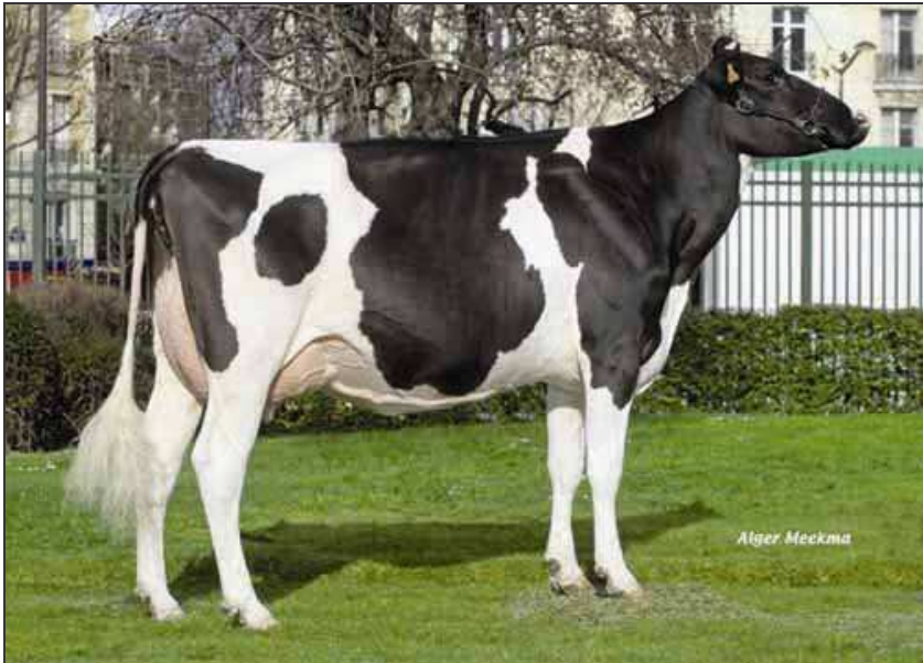
Coum Vahiné (pleine sœur de Coum Vélia).