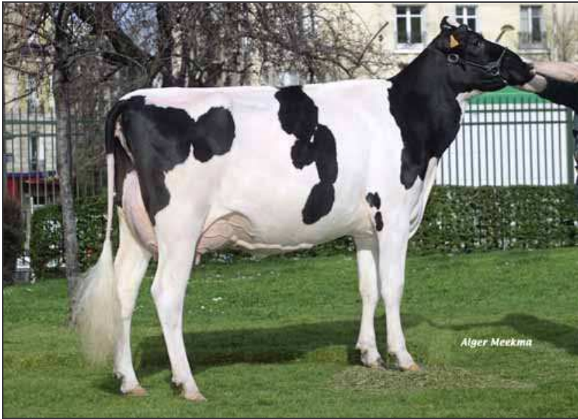
Pébi Venel en 1 ère lactation (mère de Mel'Estelle).