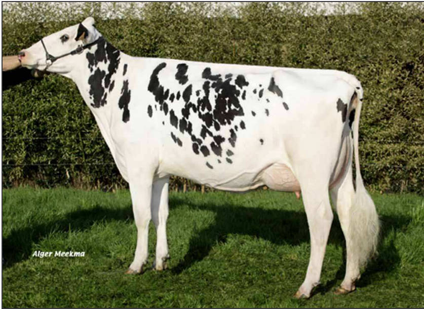
Amarante (mère de Equinoxe).