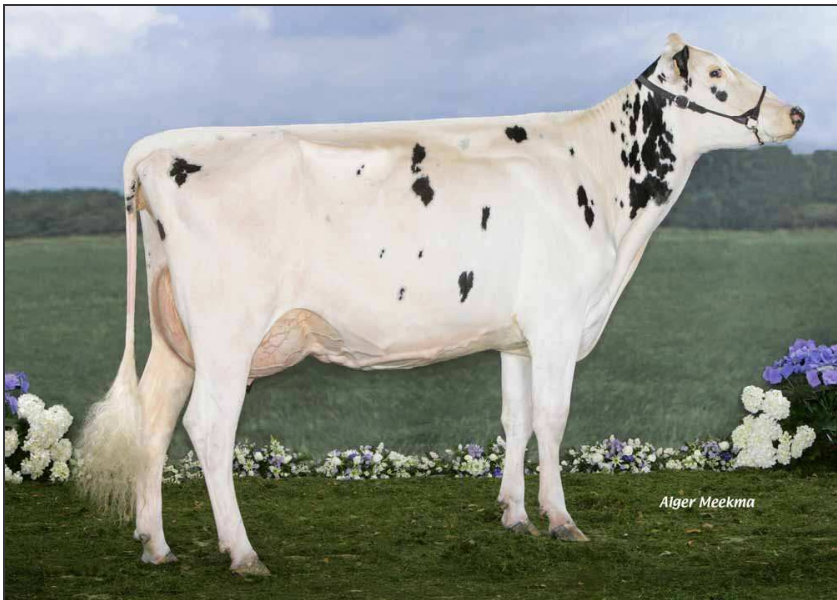
Chinoise (fille d'Amarante par Jose).